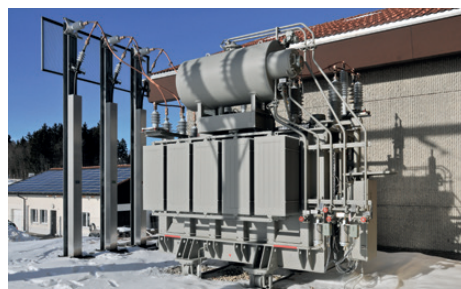
Le nouveau transformateur du Noirmont, pendant l'hiver

établie avec succès comme fournisseur de FMB. Les quatre transformateurs sont maintenant en service et le projet a été réalisé à la satisfaction de tous les intéressés.