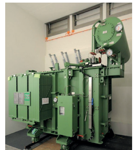
Le nouveau transformateur de Tramelan