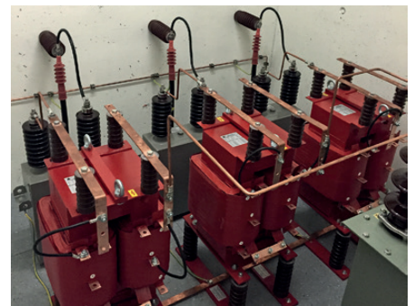
Neue, starre Parallelinkopplung im UW Ernen