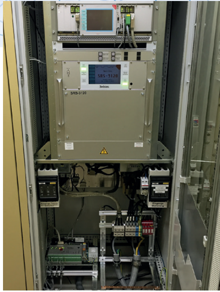
Rundsteuersender im UW Naters