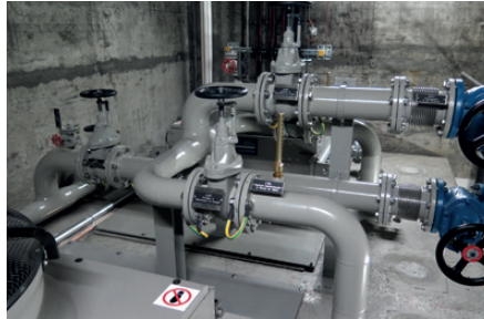
Die Ölleitungen bei den Lüftern

Die Schlusskonfektion war etwas aufwendiger, da alle Ölleitungen erst vor Ort zusammengesetzt werden konnten. Pro Transformator waren 8 Arbeitstage notwendig. Dank der guten Zusammenarbeit mit Axpo, den Mitarbeitern der ERAG und ETRA verlief der ganze Aufbau reibungslos.