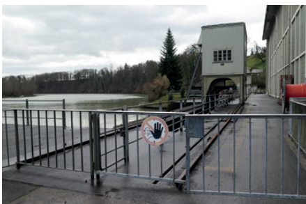
Der gestaute Rhein beim Kraftwerk Rheinau.