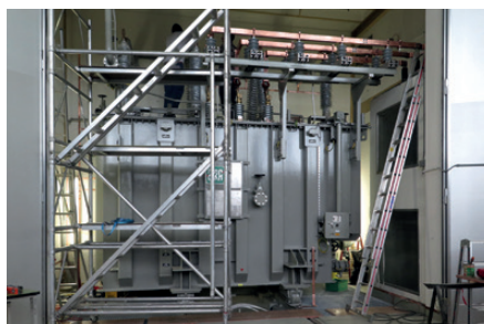
Der Transformator in seiner endgültigen Position