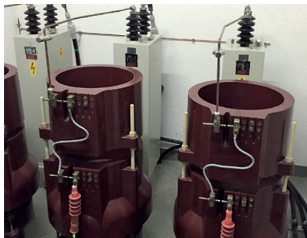
Umgebaute, starre Parallelinkopplung im UW Naters