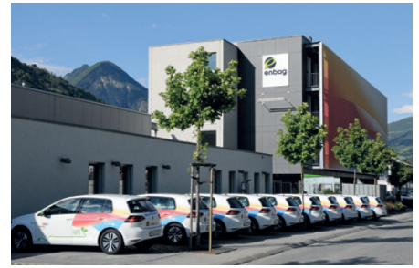
Das Verwaltungsgebäude der EnBAG AG in Brig.