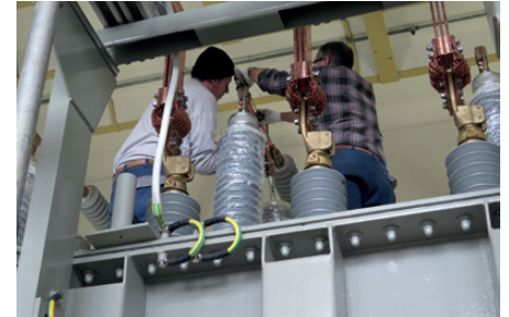
Montagearbeiten am Transformator