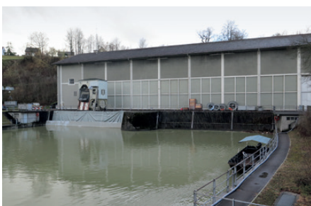
Das Maschinenhaus des KW Rheinau: der linke Wasserzufluss ist wegen der Arbeiten am Transformator gesperrt.